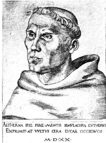
Abb. 1: Luther als Mönch 1520

In 95 Thesen in lateinischer Sprache entfaltete Luther seine Gedanken. Die Sätze sind sprachlich und theologisch anspruchsvoll, weil sie für Gelehrte gedacht waren. Nicht alle sind für heutige Leser verständlich. Luther wandte sich an die Öffentlichkeit, aber zunächst nur an die universitäre und innerkirchliche Öffentlichkeit, mit der er über seine Thesen disputieren wollte, noch nicht an die Allge-