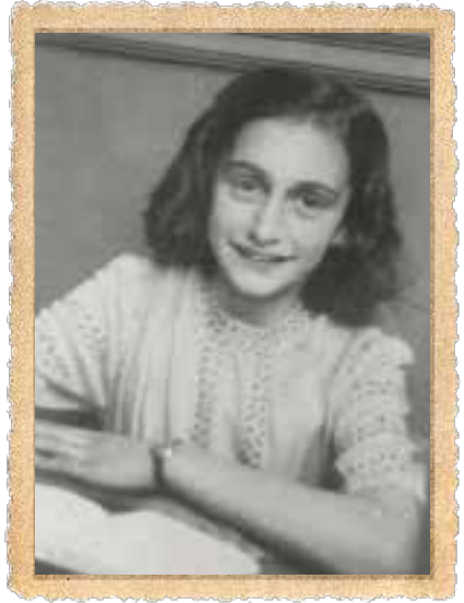
▶ Anne Frank