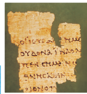
Der berühmte Papyrus P 52 mit Versen des Johannesevangeliums (um 125 n. Chr.)

Die ältesten erhaltenen Bibelhandschriften wurden seit 1947 in den Höhlen bei Qumran am Toten Meer gefunden. Dort lebte von 135 v. Chr. bis 68 n. Chr. eine religiöse Gemeinschaft. Die Schriften, die in Tonkrügen versteckt waren, reichen zurück bis ins 3. Jahrhundert v. Chr. Berühmt wurde vor allem die Jesaja-Rolle , denn mit ihr hat man eine fast komplett erhaltene Schriftrolle gefunden. Dies war ein besonderer Glücksfall; denn meist werden nur größere oder kleinere Bruchstücke entdeckt, manchmal nicht größer als eine Briefmarke. Aber jedes Fragment kann helfen, den ursprünglichen Text wiederherzustellen und Fehler aufzuspüren, die sich beim immer neuen Abschreiben der Texte eingeschlichen haben.