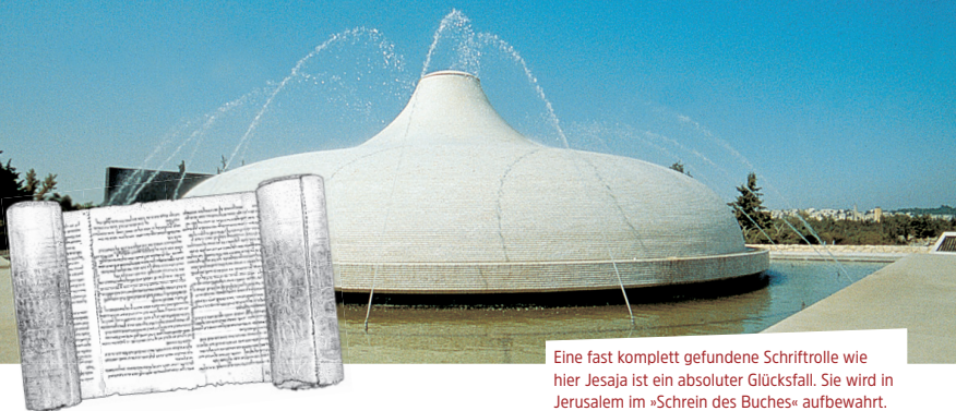
Eine fast komplett gefundene Schriftrolle wie hier Jesaja ist ein absoluter Glücksfall. Sie wird in Jerusalem im »Schrein des Buches« aufbewahrt.