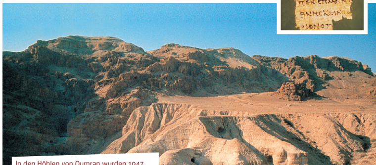
In den Höhlen von Qumran wurden 1947 zahlreiche Schriften aus der Bibel gefunden.