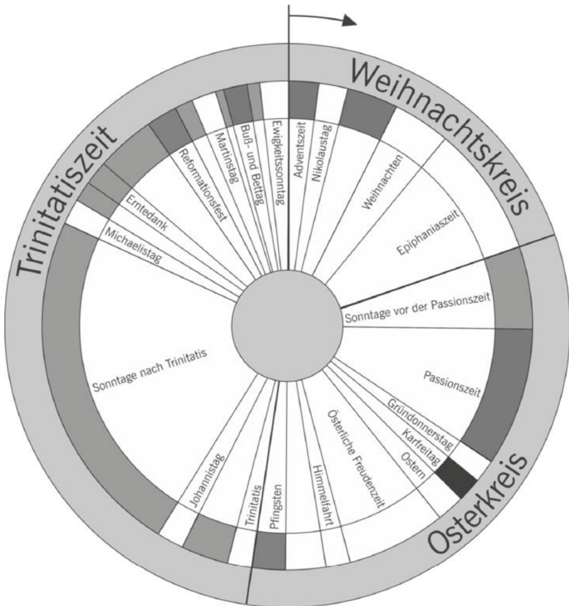
Grafik: Das Kirchenjahr 3

Mit dem Ewigkeitssonntag endet das Kirchenjahr, bevor mit dem 1. Advent das neue Kirchenjahr beginnt.