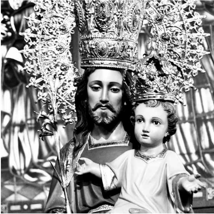
San José de la Montaña, Barcelona